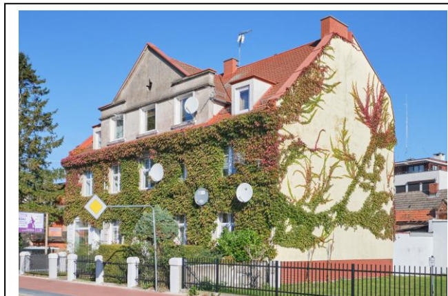
Widok ogólny od wschodu