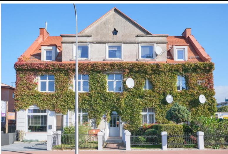
Elewacja frontowa - południowa

7. Fotografia z opisem wskazującym orientację albo mapa z zaznaczonym stanowiskiem archeologicznym