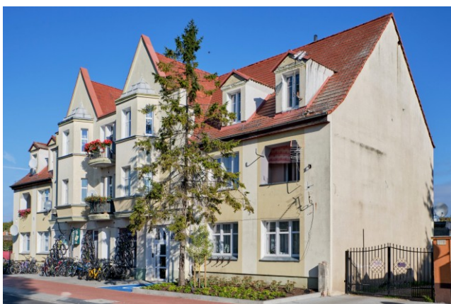
Widok ogólny od południa