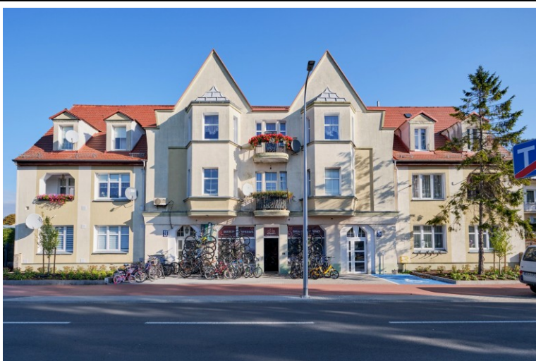
Elewacja frontowa, pld.-zachodnia

7. Fotografia z opisem wskazującym orientację albo mapa z zaznaczonym stanowiskiem archeologicznym