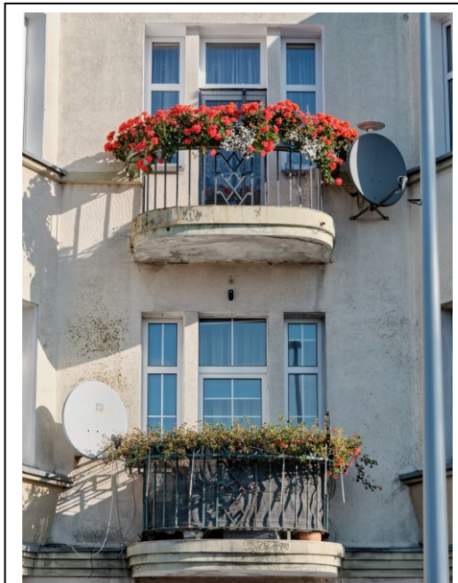
Okna z balkonami