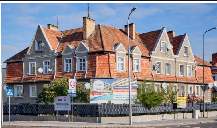
Widok ogólny od południa (z ul. Jed. Narodowej)

7. Fotografia z opisem wskazującym orientację albo mapa z zaznaczonym stanowiskiem archeologicznym