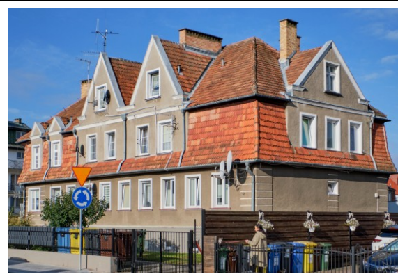
Widok ogólny od wschodu (z ul. Wylotowej)