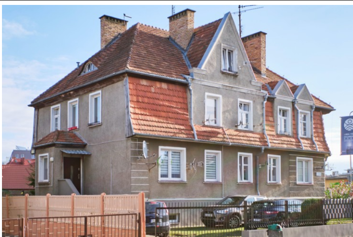
Widok ogólny od zachodu (z ul. Jed. Narodowej)