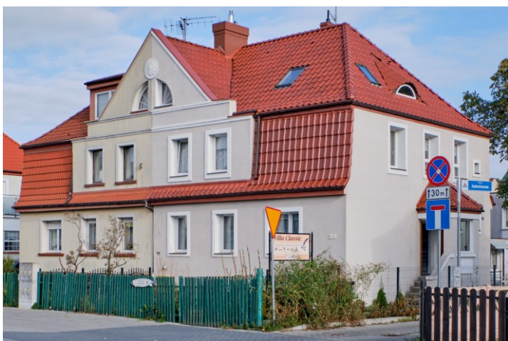
Widok ogólny od południa

7. Fotografia z opisem wskazującym orientację albo mapa z zaznaczonym stanowiskiem archeologicznym