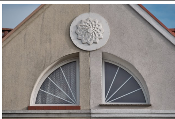
Lukarna w połaci pñ.-zachodniej