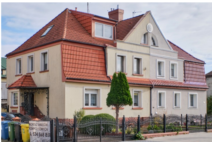
Widok ogólny od zachodu