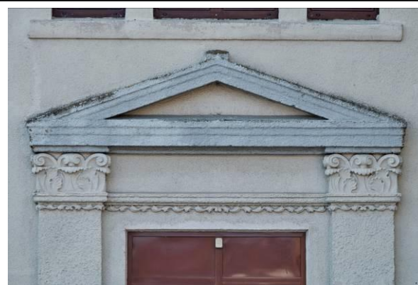
Obramienie drzwi frontowych