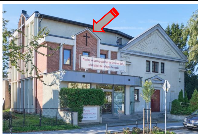
Nowa sala modlitw

Obiekt ujęty w Gminnej Ewidencji Zabytków na podstawie Zarządzenia Nr 87/14 Prezydenta Miasta Kołobrzeg z dn. 21.10.2014 r. (aktualizacja: zarządzenie nr 101/22 z dn. 26.08.2022 r.)