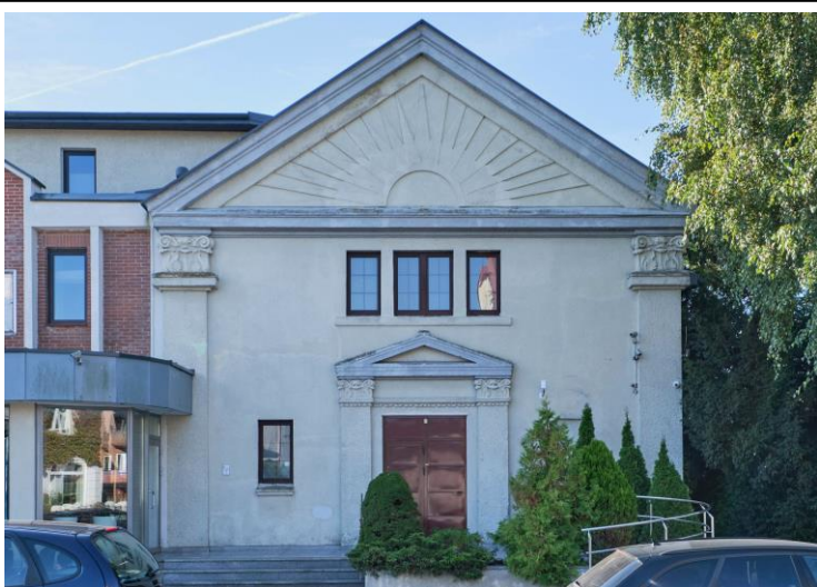
Elewacja frontowa - północna

7. Fotografia z opisem wskazującym orientację albo mapa z zaznaczonym stanowiskiem archeologicznym