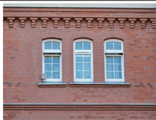
Okna IV kondygnacji