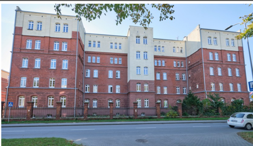
Elewacja frontowa - północna

7. Fotografia z opisem wskazującym orientację albo mapa z zaznaczonym stanowiskiem archeologicznym