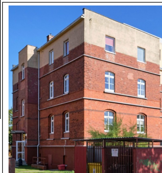
Elewacja zachodnia z ryzalitem podwórzowym