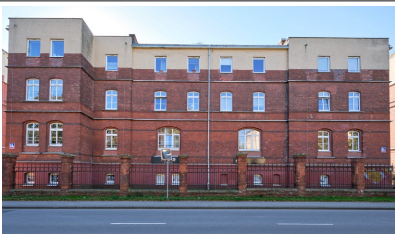
Elewacja frontowa - północna

7. Fotografia z opisem wskazującym orientację albo mapa z zaznaczonym stanowiskiem archeologicznym