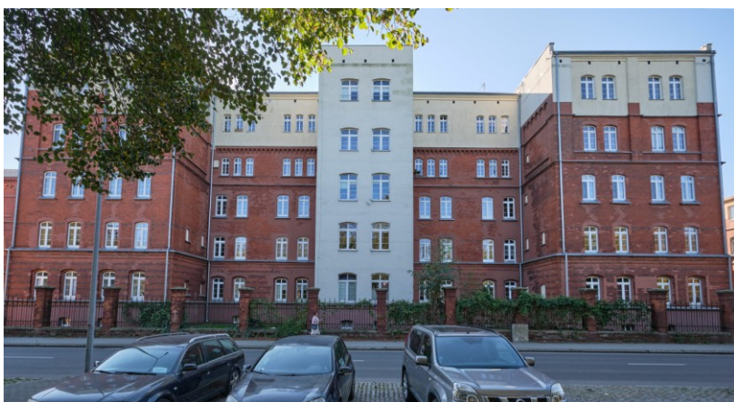
Elewacja frontowa - północna

7. Fotografia z opisem wskazującym orientację albo mapa z zaznaczonym stanowiskiem archeologicznym