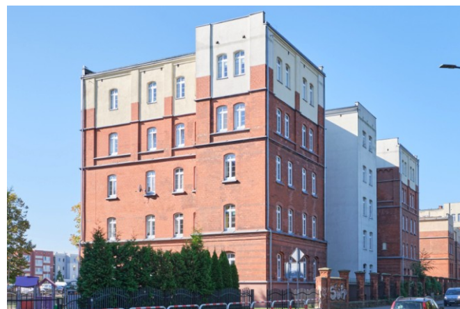
Widok ogólny od wschodu