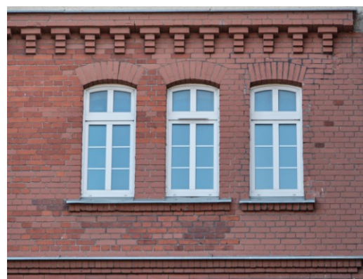
Okna i gzyms na IV kondygnacji