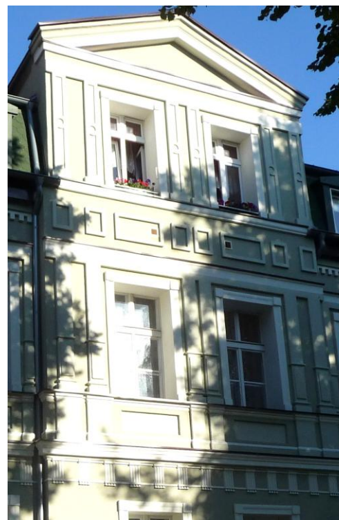
Ryzalit, widok od północnego-zachodu