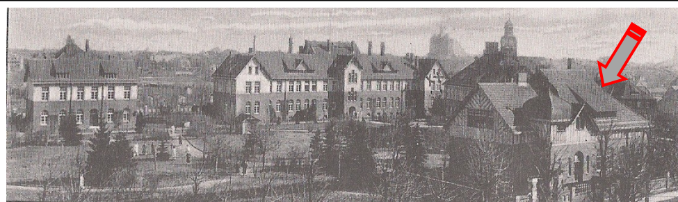
Szpital - widok z ok. 1920 r. www.fotopolska.eu