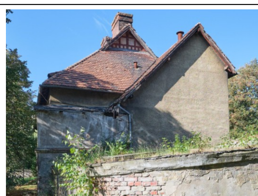
Widok ogólny od wschodu