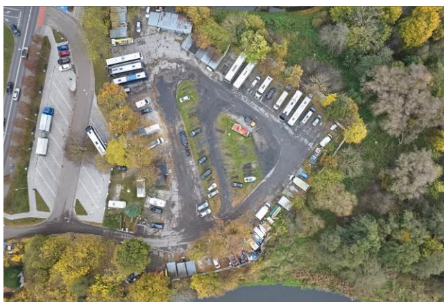
Widok ogólny z góry