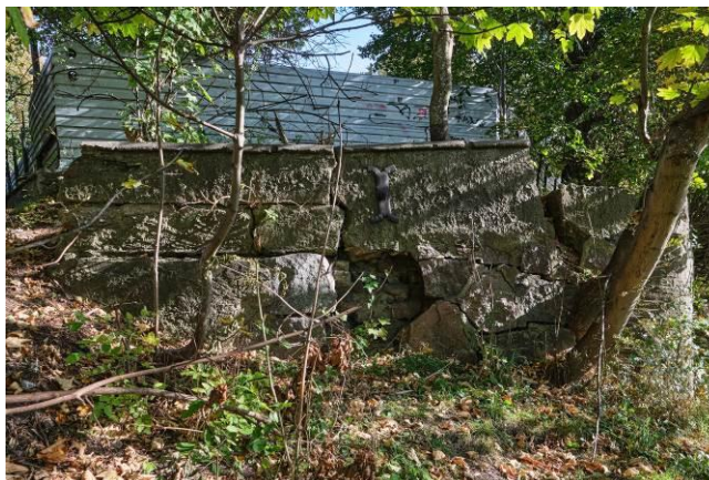
Drzewa (samosiewy) niszczące murowaną konstrukcję wałów