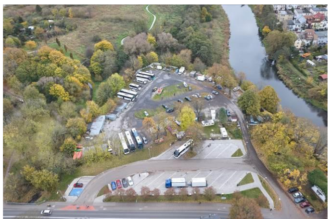
Widok ogólny od strony północno zachodniej

7. Fotografia z opisem wskazującym orientację albo mapa z zaznaczonym stanowiskiem archeologicznym