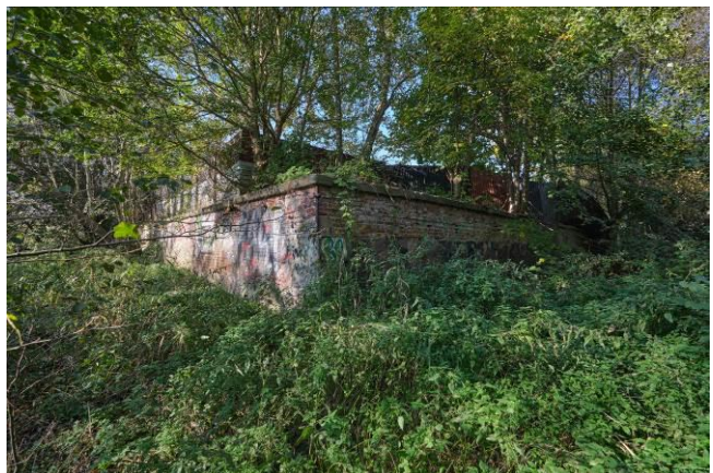
Ceglano kamienny „węgiel” Bastionu Magdeburg