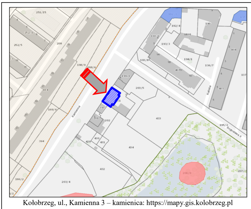
Kolobrzeg, ul., Kamienna 3 – kamienica: https://mapy.gis.kolobrzeg.pl

Architektura obiektu (w typie kamienicy czynszowej) o neorenesansowym wystroju fasady jest charakterystyczna dla budownictwa miejskiego k. XIX w. Obiekt zachował wartości kulturowe. W najbliższym otoczeniu nowoczesnych bloków mieszkalnych jest cennym zabytkiem dokumentującym istnienie historycznej zabudowy ulicy.