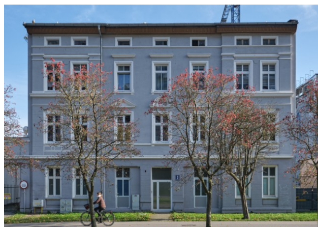
Widok na fasadę od strony zachodniej