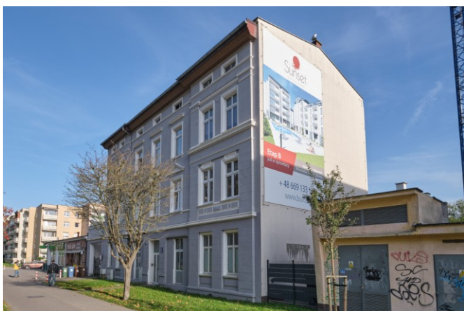
Widok ogólny bryły od strony południowo-zachodniej

7. Fotografia z opisem wskazującym orientację albo mapa z zaznaczonym stanowiskiem archeologicznym