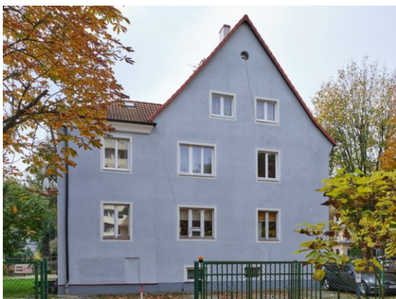
Elewacja wschodnia z ryzalitem