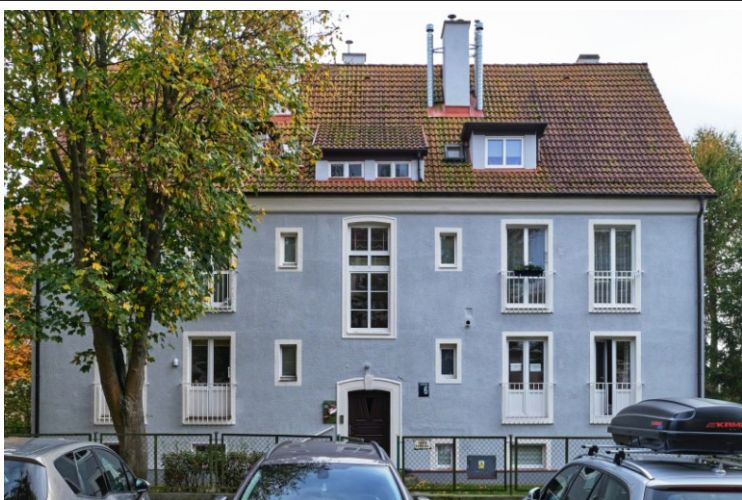
Elewacja frontowa - północna

7. Fotografia z opisem wskazującym orientację albo mapa z zaznaczonym stanowiskiem archeologicznym