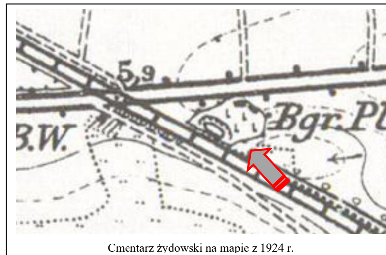
Cmentarz żydowski na mapie z 1924 r.