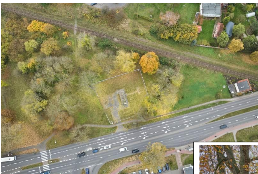
Widok ogólny z lotu ptaka od płn.

7. Fotografia z opisem wskazującym orientację albo mapa z zaznaczonym stanowiskiem archeologicznym