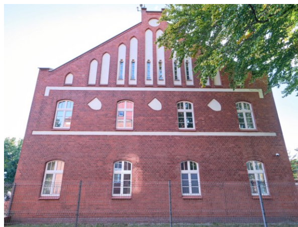
Elewacja szczytowa płn.-wschodnia