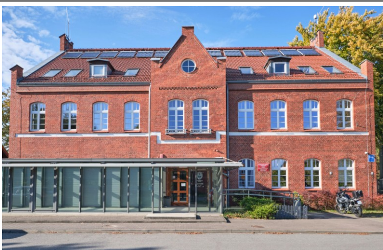
Elewacja płd.-wschodnia (podwórzowa)

7. Fotografia z opisem wskazującym orientację albo mapa z zaznaczonym stanowiskiem archeologicznym