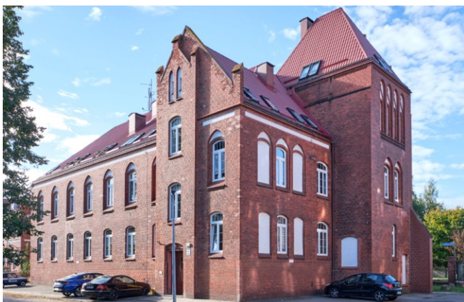
Widok ogólny od wschodu