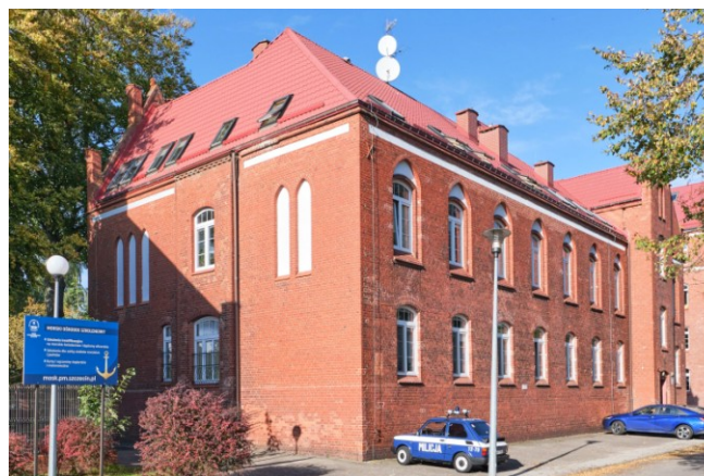
Widok ogólny od południa