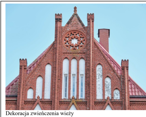
Dekoracja zwieńczenia wieży