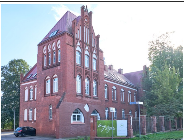
Widok ogólny od północy (z ul. Mazowieckiej)

7. Fotografia z opisem wskazującym orientację albo mapa z zaznaczonym stanowiskiem archeologicznym