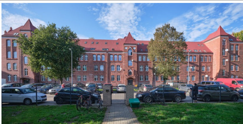
Elewacja pół.-wschodnia (podwórzowa)

7. Fotografia z opisem wskazującym orientację albo mapa z zaznaczonym stanowiskiem archeologicznym