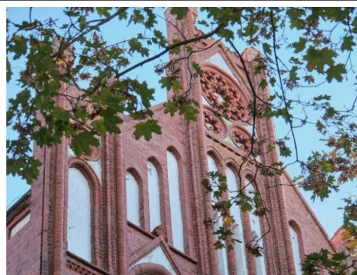
Zwieńczenie ryzalitu półn.-zachodniego