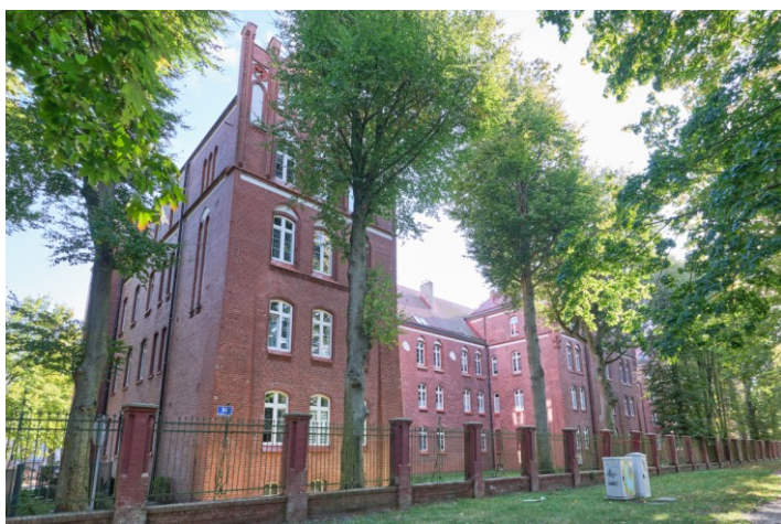
Widok ogólny od półn.-zachodu (z ul. Mazowieckiej)

Obiekt ujęty w Gminnej Ewidencji Zabytków na podstawie Zarządzenia Nr 87/14 Prezydenta Miasta Kołobrzeg z dn. 21.10.2014 r. (aktualizacja: zarządzenie nr 101/22 z dn. 26.08.2022 r.)