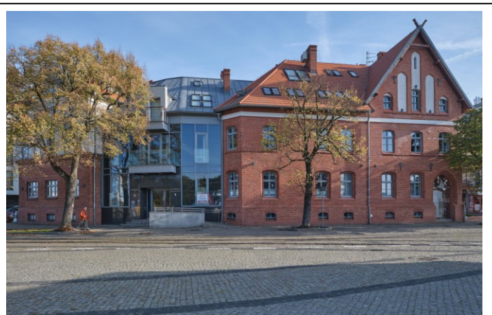
Widok bryły od strony południowo-zachodniej