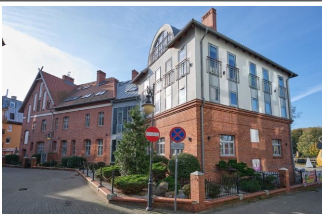
Widok ogólny bryły od strony północno-wschodniej