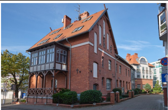
Widok ogólny bryły od strony wschodniej

7. Fotografia z opisem wskazującym orientację albo mapa z zaznaczonym stanowiskiem archeologicznym