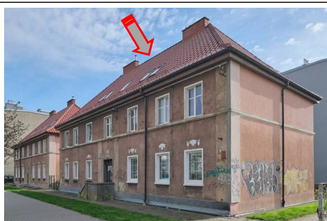
Widok ogólny bryły od strony północno-zachodniej

7. Fotografia z opisem wskazującym orientację albo mapa z zaznaczonym stanowiskiem archeologicznym