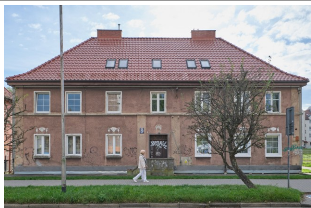
Widok elewacji frontowej od strony północnej