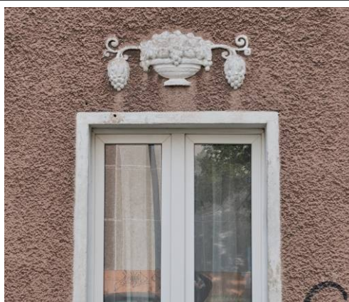
Fragment fasady, dekoracja nad oknem parteru