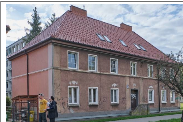
Widok ogólny bryły od strony północno-wschodniej