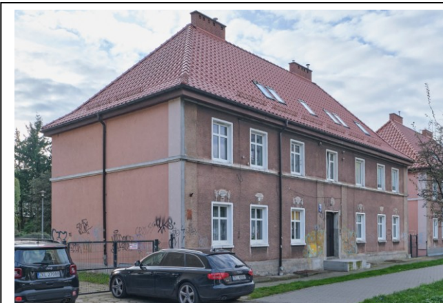
Widok ogólny bryły od strony północno-wschodniej