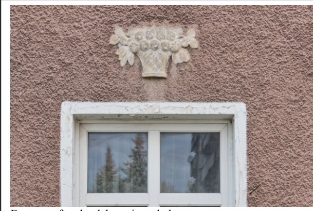
Fragment fasady, dekoracja nad oknem parteru