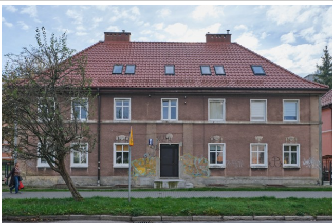
Widok fasady od strony północnej