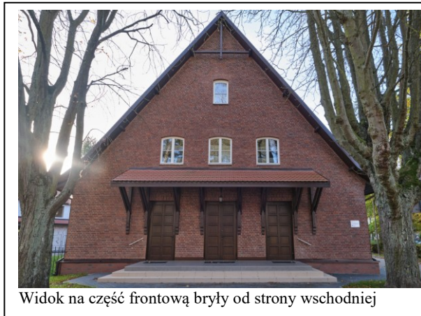
Widok na część frontową bryły od strony wschodniej