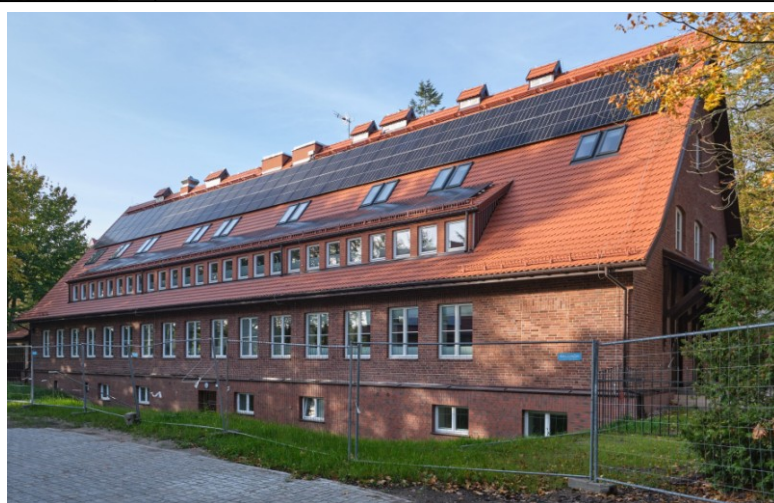
Widok na elewację boczną południową