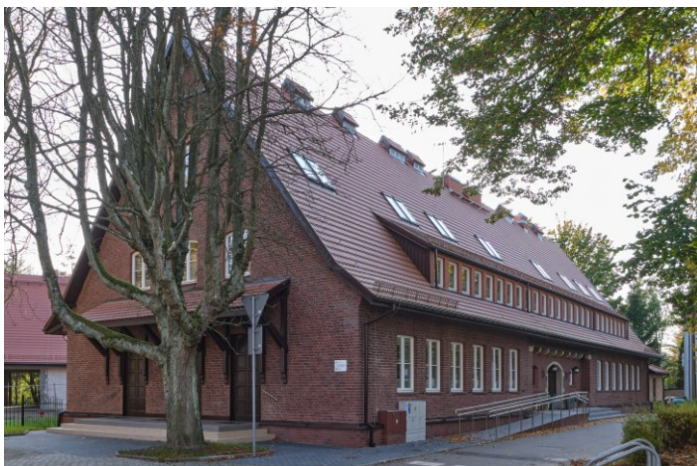
Widok ogólny bryły od strony północno-wschodniej

7. Fotografia z opisem wskazującym orientację albo mapa z zaznaczonym stanowiskiem archeologicznym