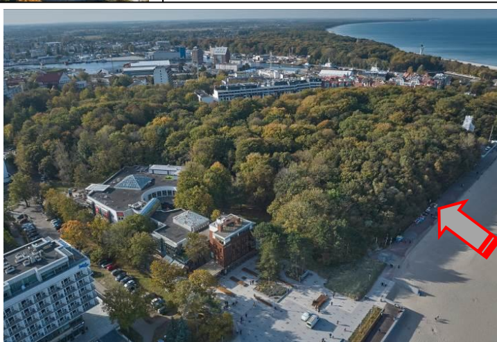
Widok ogólny z lotu ptaka na część zach. parku od płn.-wsch.