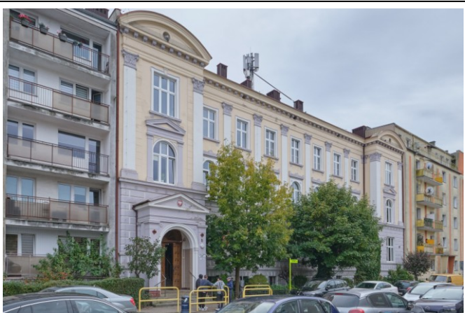
Widok ogólny bryły od strony północno-zachodniej

7. Fotografia z opisem wskazującym orientację albo mapa z zaznaczonym stanowiskiem archeologicznym