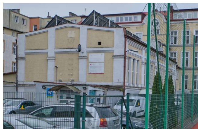
Budynek sali gimnastycznej na tyłach szkoły