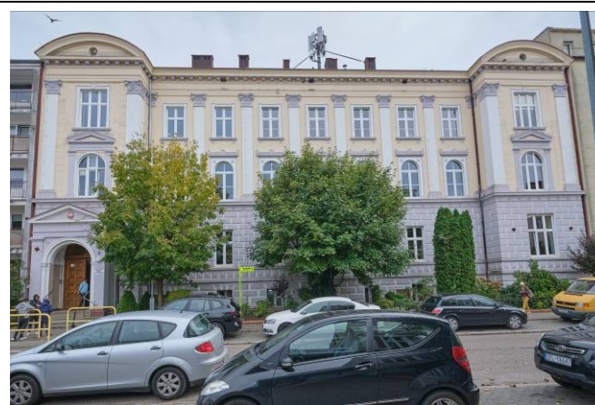
Widok elewacji frontowej, zachodniej