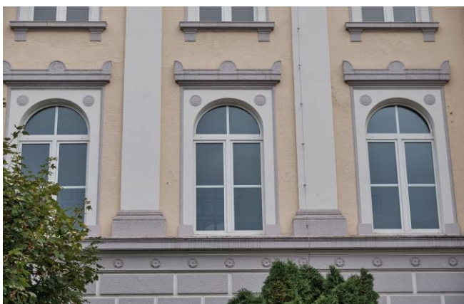
Fasada, część środkowa, wystrój architektoniczny