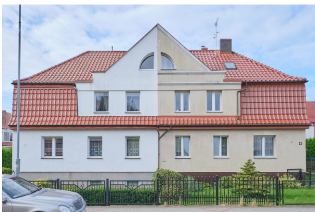
Widok na elewację frontową, wschodnią