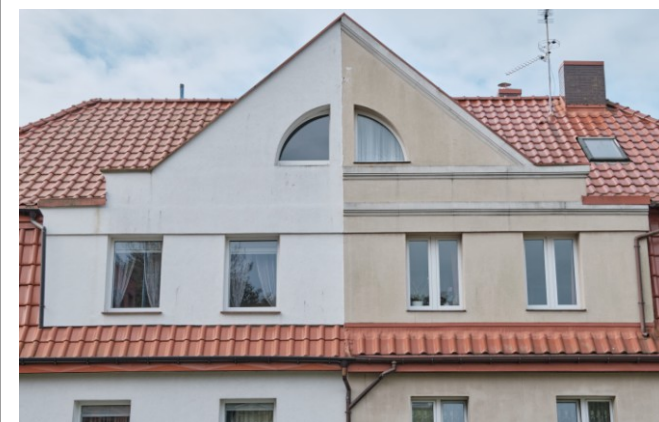
Wystawka ze szczytem elewacji frontowej