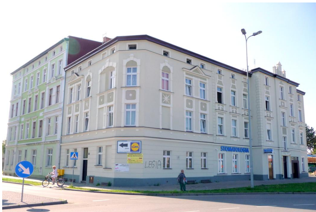
Widok budynku od północnego-zachodu

ul. Jedności Narodowej 78 78-100 Kołobrzeg dz. nr 171 obr. 11