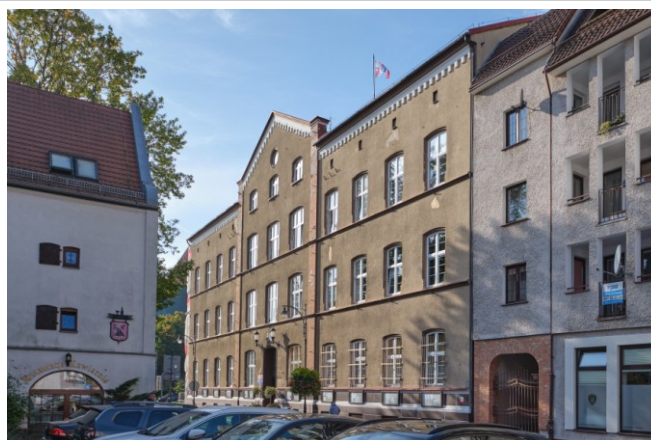
Widok na elewację frontową od północnego wschodu