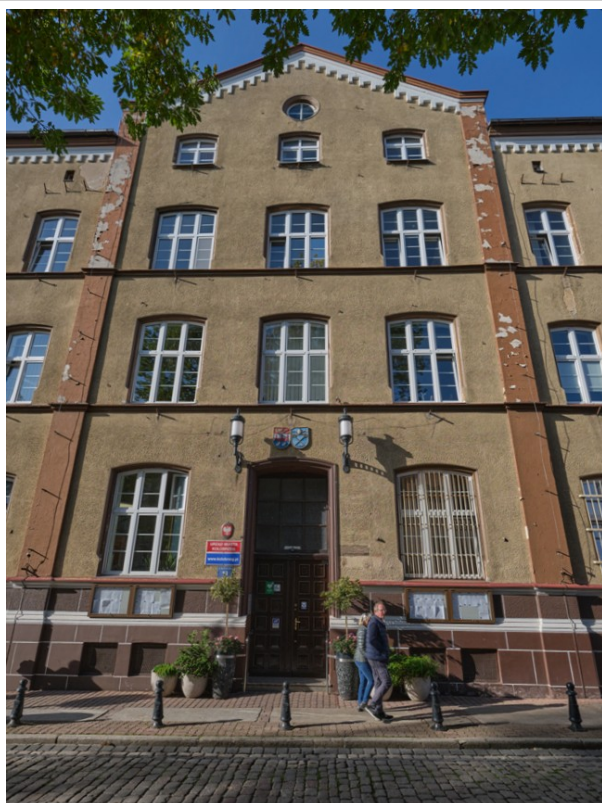
Fasada (elewacja wschodnia), widok na część środkową

Obiekt ujęty w Gminnej Ewidencji Zabytków na podstawie Zarządzenia Nr 87/14 Prezydenta Miasta Kołobrzeg z dn. 21.10.2014 r. ( aktualizacja: zarządzenie nr 101/22 z dn. 26.08.2022 r.)