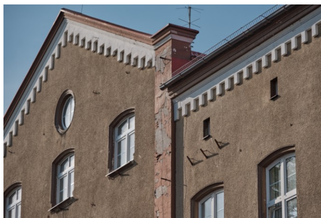
Detale wystroju fasady