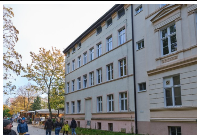
Widok ogólny bryły od strony północno-zachodniej