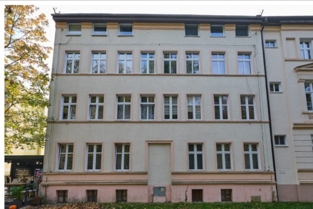
Widok elewacji frontowej, północnej