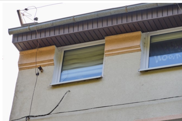
Fragment fasady, z częściowo zachowanym gzymsem