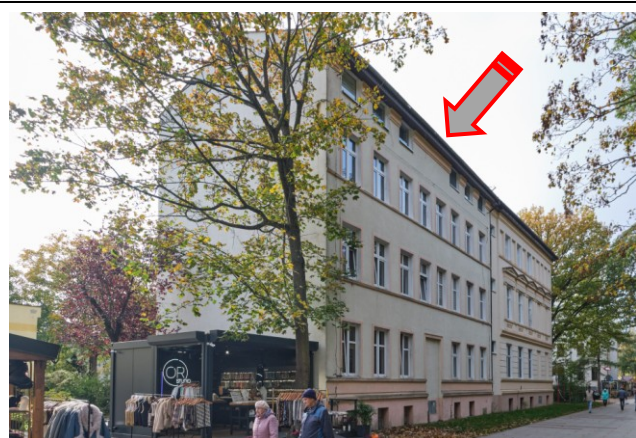
Widok ogólny bryły od strony północno-wschodniej

7. Fotografia z opisem wskazującym orientację albo mapa z zaznaczonym stanowiskiem archeologicznym