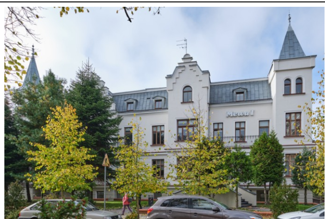
Widok ogólny bryły od strony północno-wschodniej

7. Fotografia z opisem wskazującym orientację albo mapa z zaznaczonym stanowiskiem archeologicznym