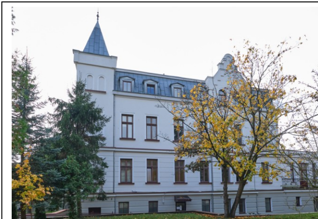
Widok ogólny skrzydła północnego