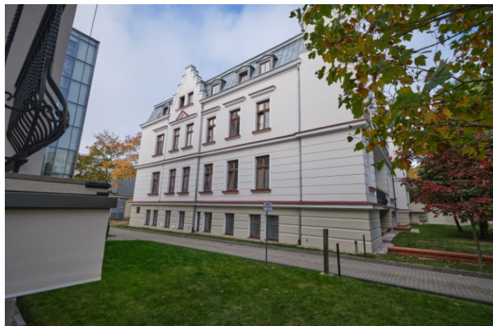
Widok ogólny skrzydła południowego