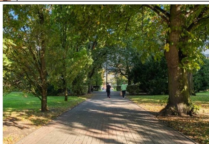
Jedna z alejek diagonalnej kompozycji