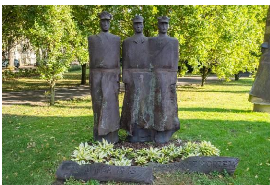
Jeden z pomników