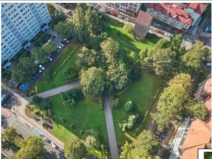
Widok z lotu ptaka od płn.-wsch.

7. Fotografia z opisem wskazującym orientację albo mapa z zaznaczonym stanowiskiem archeologicznym