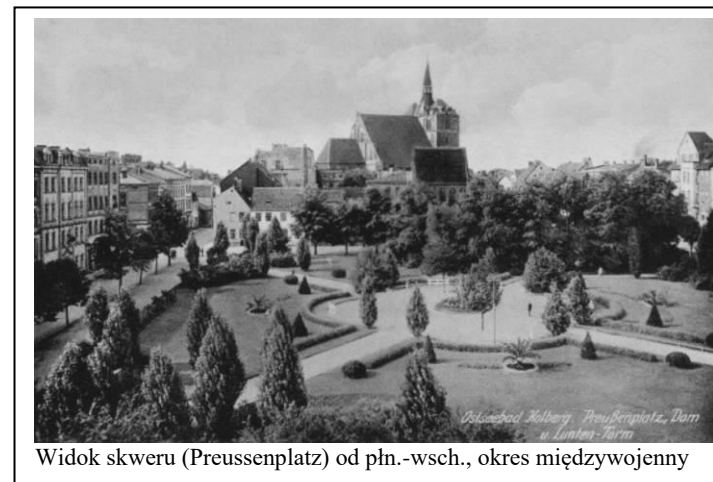
Oprac.: A. Bartczak, K. Tymbarski