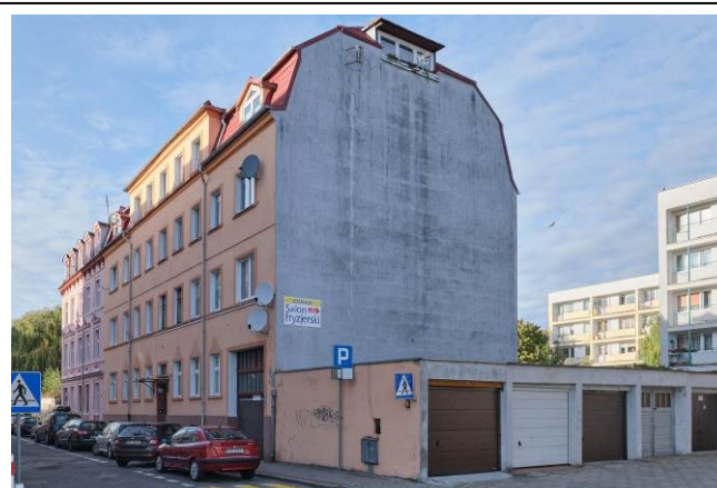
Widok ogólny bryły od strony południowo-wschodniej