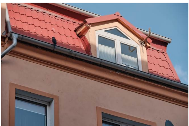
Prawa lukarna w elewacji frontowej