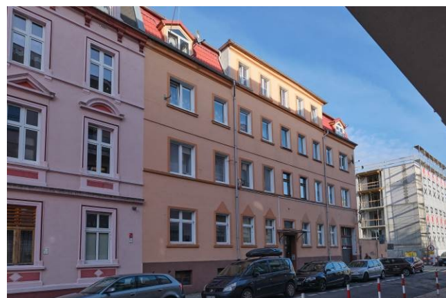
Widok ogólny bryły od strony zachodniej