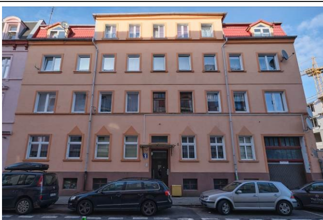
Elewacja frontowa – południowa

7. Fotografia z opisem wskazującym orientację albo mapa z zaznaczonym stanowiskiem archeologicznym