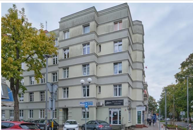
Widok ogólny bryły od strony zachodniej