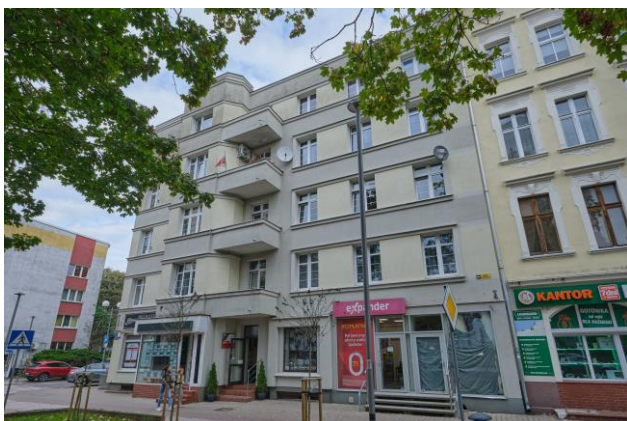
Widok ogólny bryły od strony południowej

7. Fotografia z opisem wskazującym orientację albo mapa z zaznaczonym stanowiskiem archeologicznym