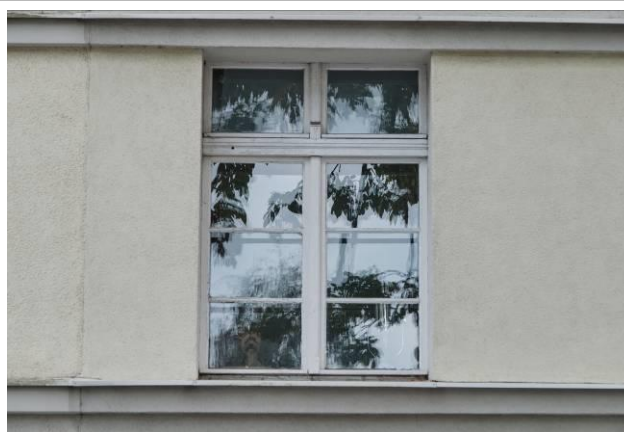
Zachowana oryginalna stolarka okienna