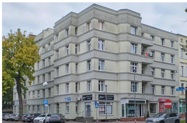
Widok ogólny bryły od strony południowo-zachodniej