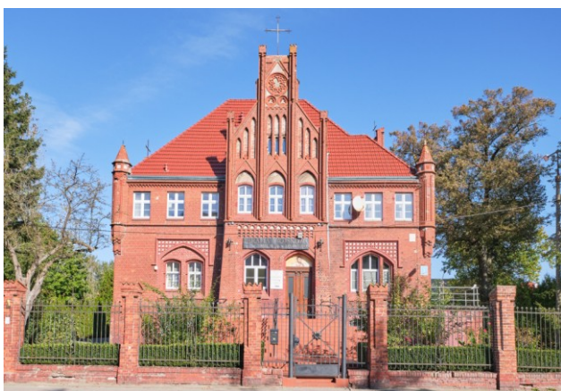
Widok elewacji frontowej, południowej