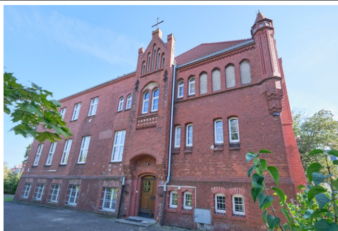
Widok ogólny bryły od strony południowo-zachodniej