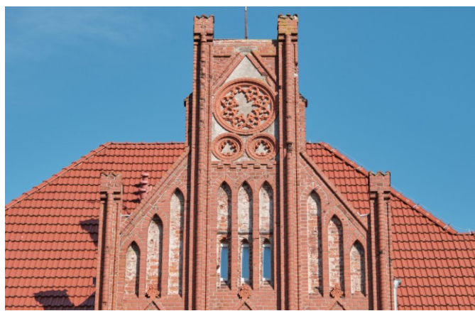
Szczyt wieńczący ryzalit elewacji frontowej