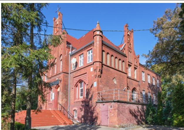
Widok ogólny bryły od strony południowo-wschodniej

7. Fotografia z opisem wskazującym orientację albo mapa z zaznaczonym stanowiskiem archeologicznym