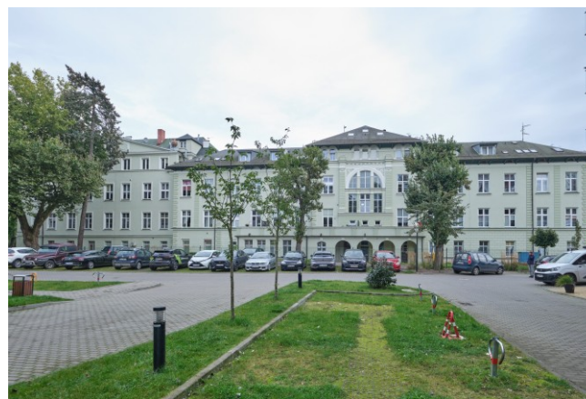
Widok ogólny bryły od strony zachodniej