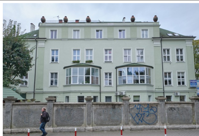
Widok ogólny bryły od strony południowej