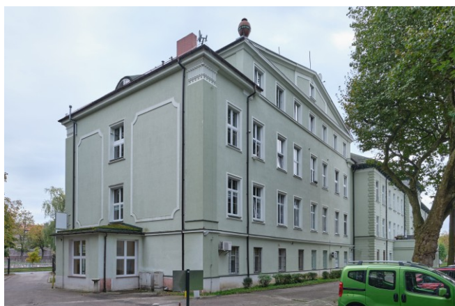
Widok ogólny bryły od strony wschodniej