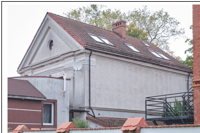
Widok ogólny bryły od strony południowej