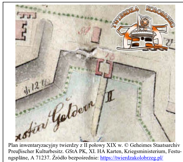
Plan inwentaryacyjny twierdzy z II połowy XIX w. © Geheimes Staatsarchiv Preußischer Kulturbesitz. GStA PK, XI. HA Karten, Kriegsministerium, Festungspläne, A 71237. Źródło bezpośrednie: https://twierdzakolobrzeg.pl/

Ochrona w zakresie zachowania: bryły budynku, wystroju architektonicznego elewacji oraz kształtu i rozmieszczenia okien.