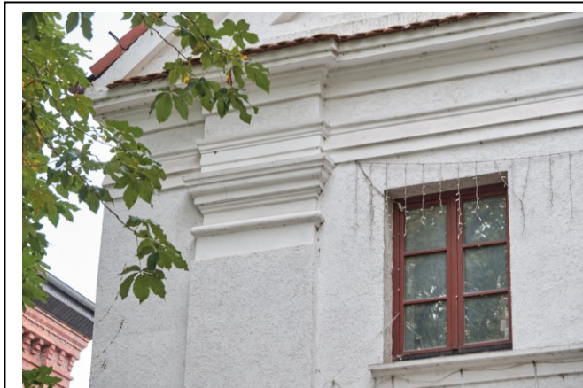
Detal okna i gzymsu wieńczącego