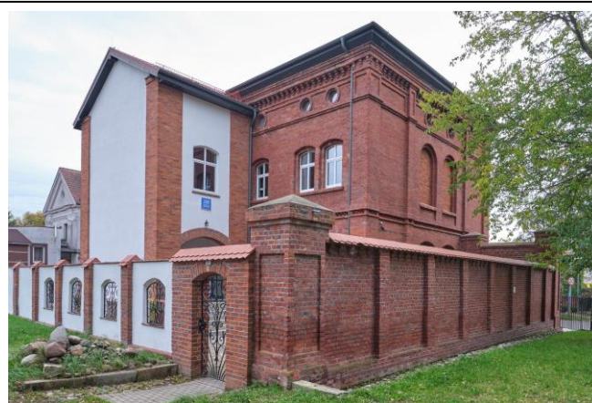
Widok ogólny bryły od strony południowej