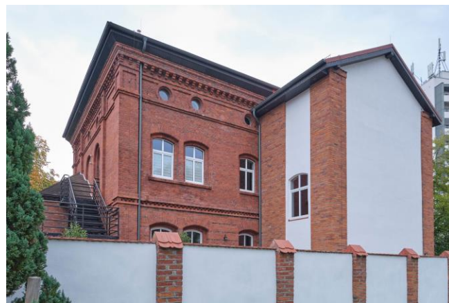
Widok ogólny bryły od strony zachodniej