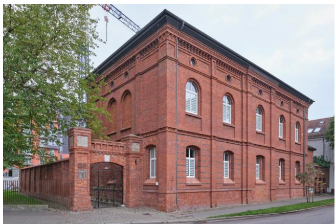
Widok ogólny bryły od strony wschodniej