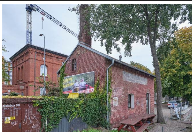
Widok ogólny bryły od strony zachodniej