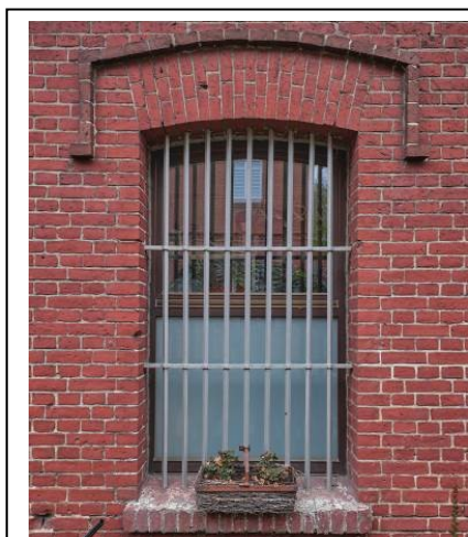
Okno w elewacji pd.-wsch.