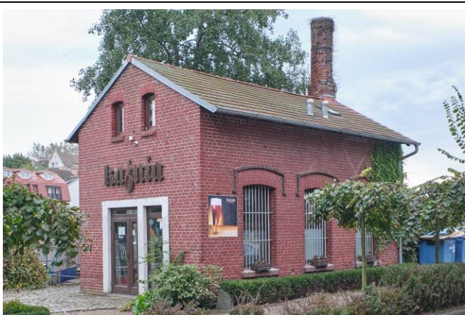
Widok ogólny bryły od strony wschodniej

7. Fotografia z opisem wskazującym orientację albo mapa z zaznaczonym stanowiskiem archeologicznym