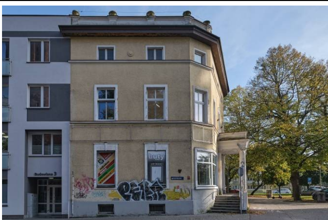
Elewacja północno-zachodnia (od ul. Budowlanej)

7. Fotografia z opisem wskazującym orientację albo mapa z zaznaczonym stanowiskiem archeologicznym