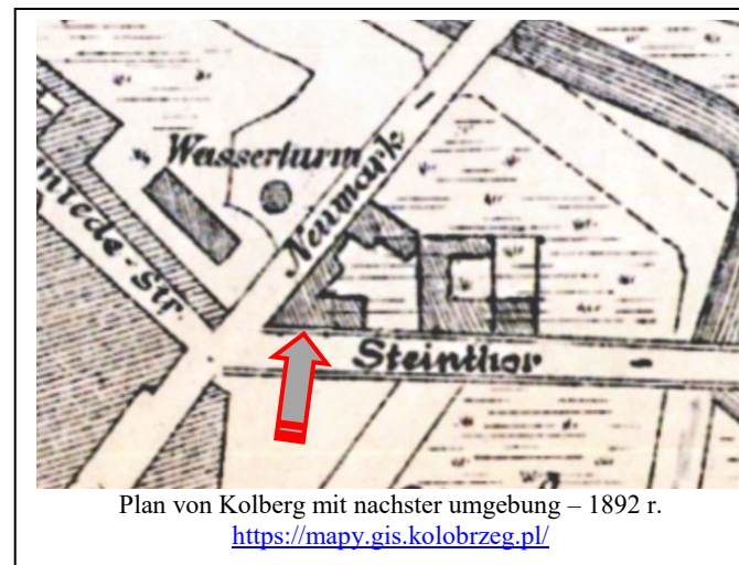
Plan von Kolberg mit nachster umgebung – 1892 r.

Ochrona w zakresie zachowania: bryły budynku, wystroju architektonicznego elewacji oraz kształtu, podziałów i rozmieszczenia okien.