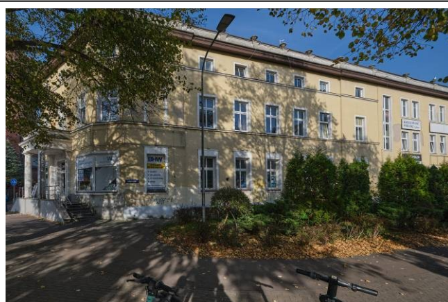
Elewacja południowa (równoległa do ulicy Słowińców)