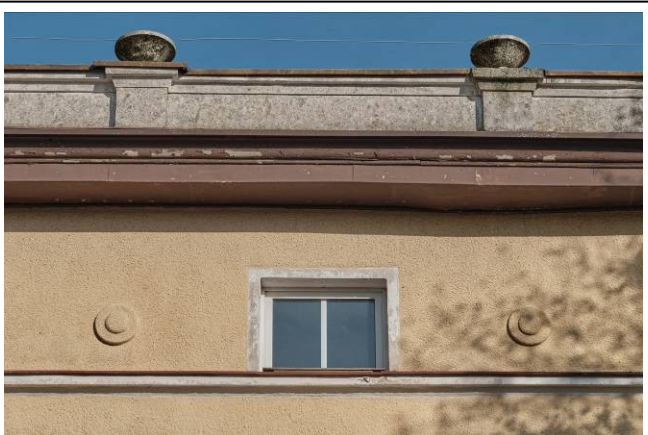
Detal architektoniczny zwieńczenia budynku