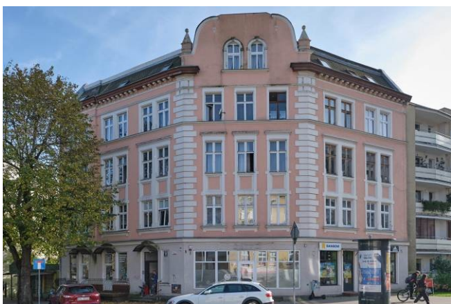
Skośne załamanie narożnika budynku od strony pn.-zach.

7. Fotografia z opisem wskazującym orientację albo mapa z zaznaczonym stanowiskiem archeologicznym