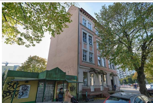
Widok ogólny bryły od strony północno-zachodniej