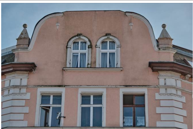
Szczyt budynku na załamaniu (ścięciu) rzutu