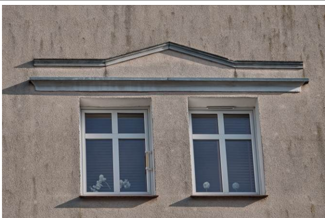
Detal architektoniczny w elewacji zachodniej