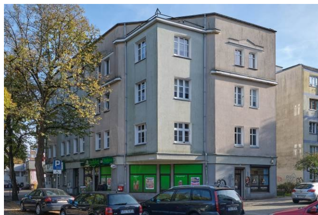
Widok ogólny bryły od strony północno-zachodniej