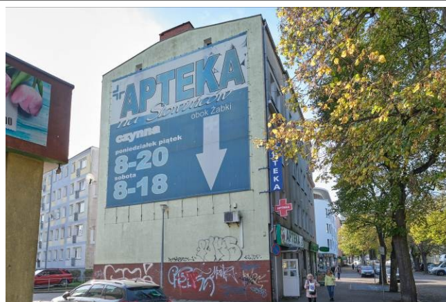
Szczyt wschodni kamienicy