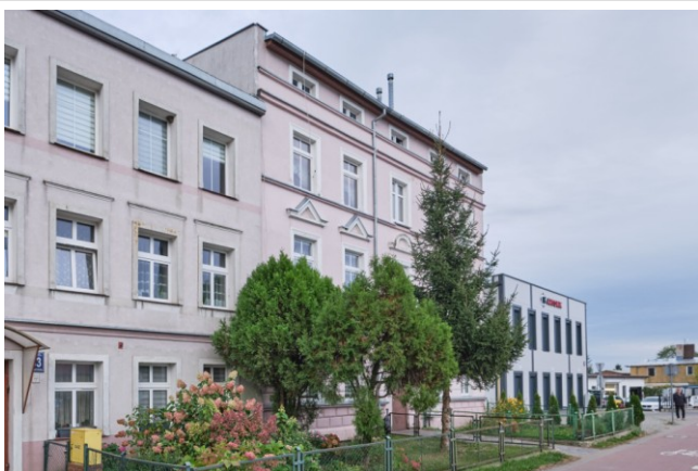
Widok ogólny bryły od strony północno-zachodniej

7. Fotografia z opisem wskazującym orientację albo mapa z zaznaczonym stanowiskiem archeologicznym