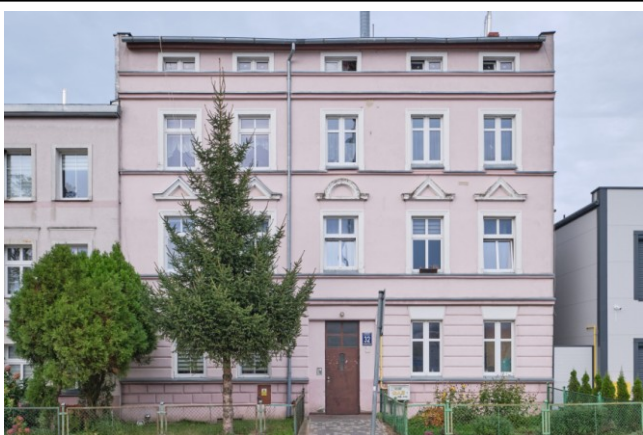
Widok fasady od strony zachodniej