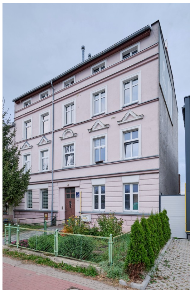
Widok ogólny kamienicy od strony południowo-zachodniej