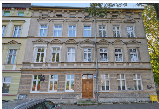
Widok na elewację frontową od strony północno-wschodniej