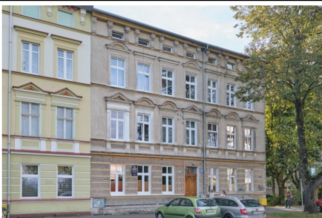
Widok ogólny bryły od strony wschodniej

7. Fotografia z opisem wskazującym orientację albo mapa z zaznaczonym stanowiskiem archeologicznym