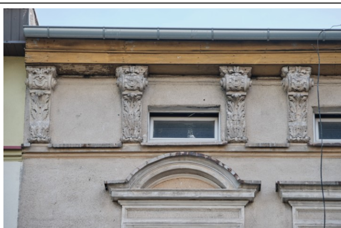
Fasada, detale wystroju – gzyms wieńczący