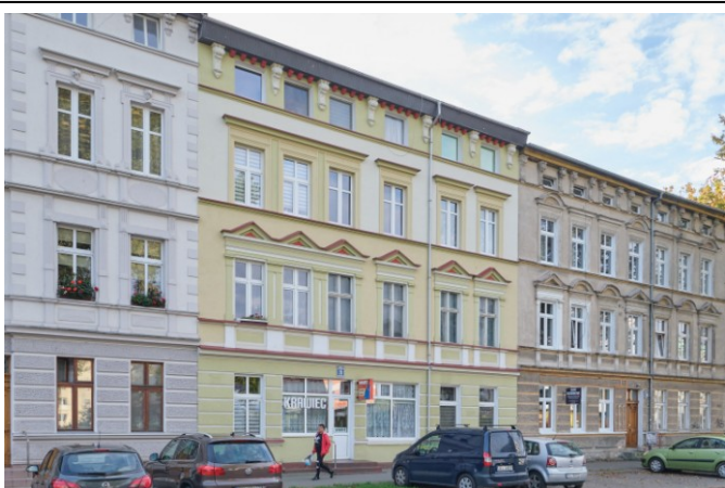
Widok ogólny bryły od strony północno-wschodniej

7. Fotografia z opisem wskazującym orientację albo mapa z zaznaczonym stanowiskiem archeologicznym