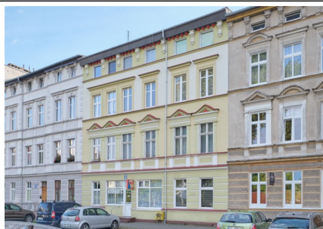
Widok ogólny bryły od strony północno-zachodniej