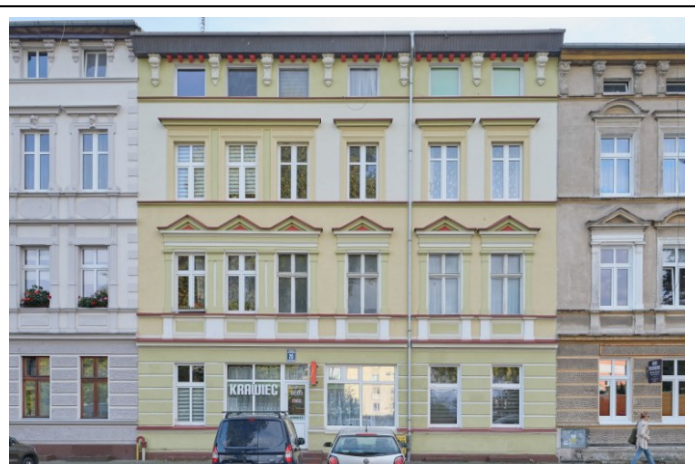
Widok na elewację frontową północną