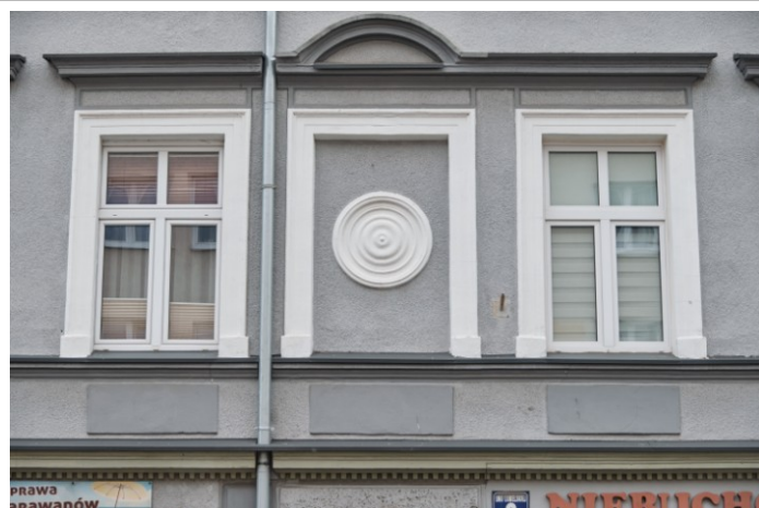
Fasada, detale tynkarskiego wystroju