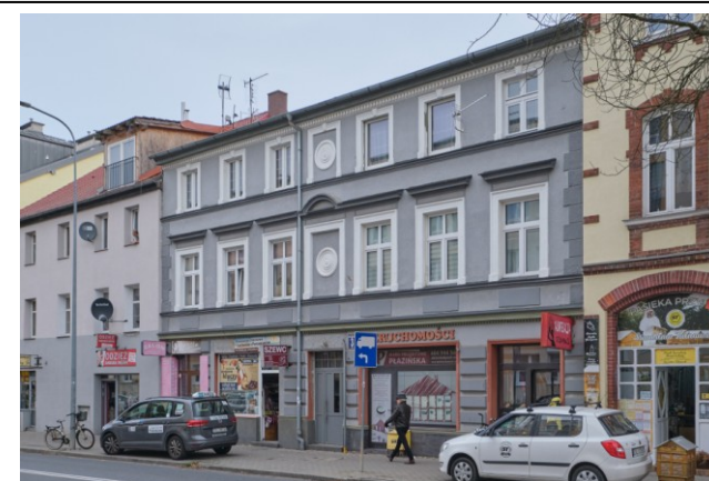
Widok ogólny bryły od strony południowo-zachodniej