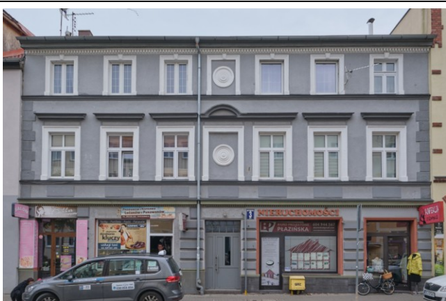
Widok ogólny fasady od strony zachodniej

7. Fotografia z opisem wskazującym orientację albo mapa z zaznaczonym stanowiskiem archeologicznym