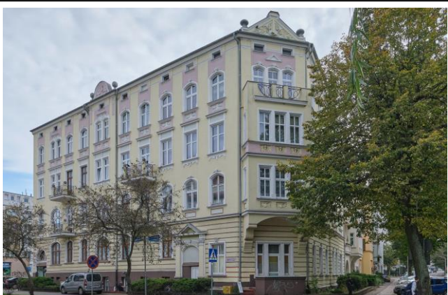
Widok ogólny bryły od płn.-zach., z fasadą od ul. Unii Lubelskiej

7. Fotografia z opisem wskazującym orientację albo mapa z zaznaczonym stanowiskiem archeologicznym