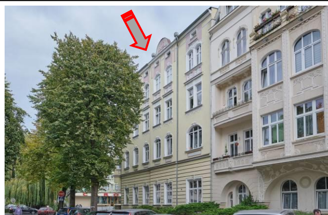
Widok na fasadę zachodnią, od ul. Granicznej