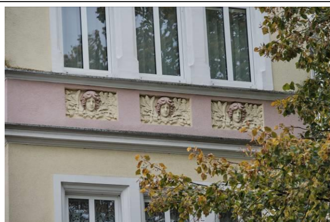
Detale wystroju sztukatorskiego