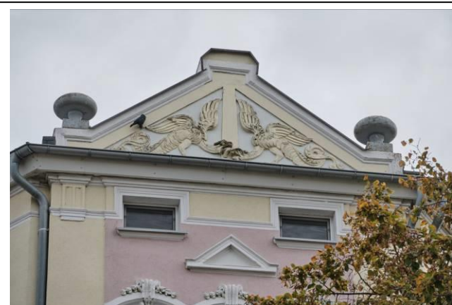
Zwieńczenie części narożnej