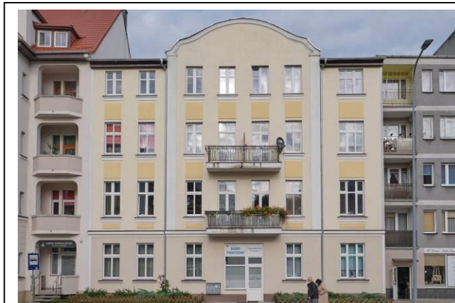
Widok na elewację frontową od strony południowo-zachodniej