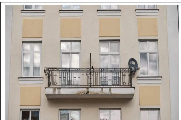
Fasada, fragment środkowy, balkon z oryginalną balustradą