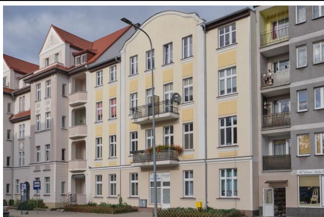
Widok ogólny bryły od strony południowej

7. Fotografia z opisem wskazującym orientację albo mapa z zaznaczonym stanowiskiem archeologicznym