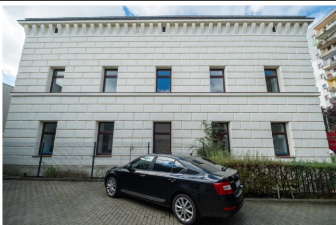
Elewacja boczna (północna)