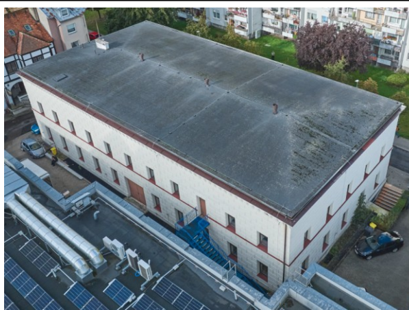
Widok ogólny bryły z lotu ptaka od północnego wschodu