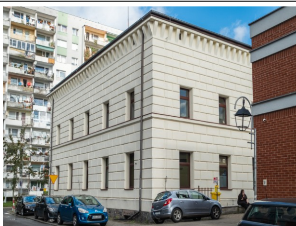
Widok ogólny bryły od południowego wschodu