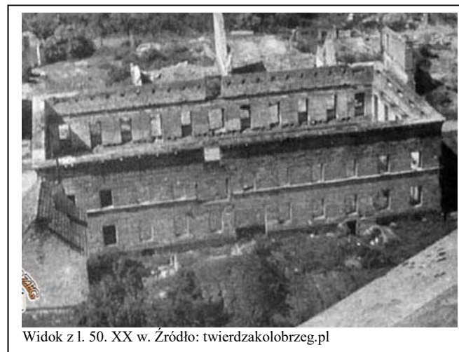
Widok z l. 50. XX w.

/ukształtowania bryły/ konstrukcji i materiału budowlanego/ ukształtowania elewacji w tym rozmieszczenia i formy otworów/ bezpośredniego otoczenia obiektu zabytkowego