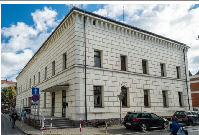
Widok ogólny bryły od południowego zachodu

7. Fotografia z opisem wskazującym orientację albo mapa z zaznaczonym stanowiskiem archeologicznym