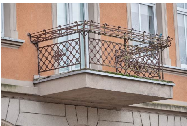
Detal architektoniczny – kuta balustrada balkonu