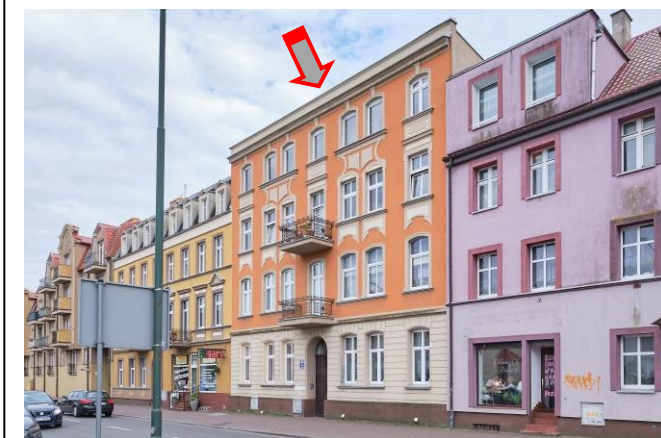
Widok ogólny bryły od strony zachodniej