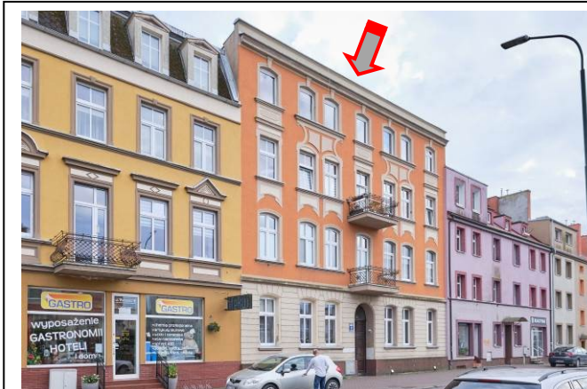
Widok ogólny bryły od strony wschodniej