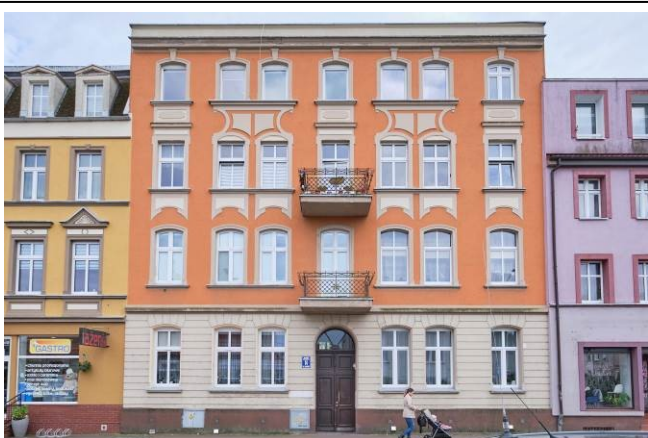
Elewacja frontowa – północna

7. Fotografia z opisem wskazującym orientację albo mapa z zaznaczonym stanowiskiem archeologicznym