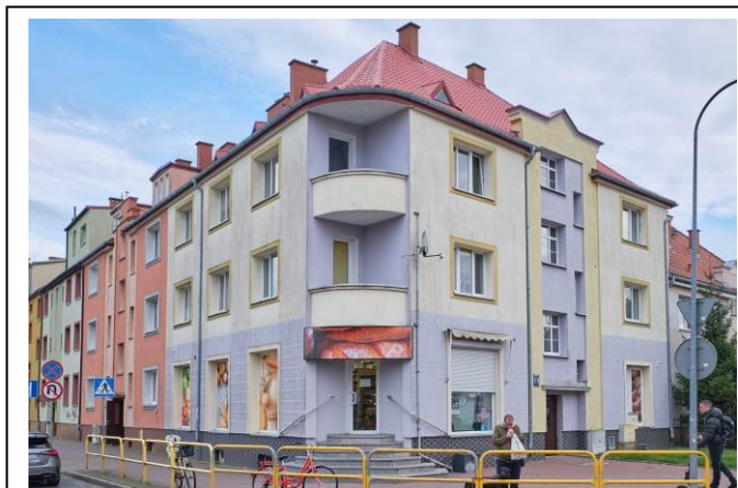
Widok ogólny bryły od strony północno-zachodniej