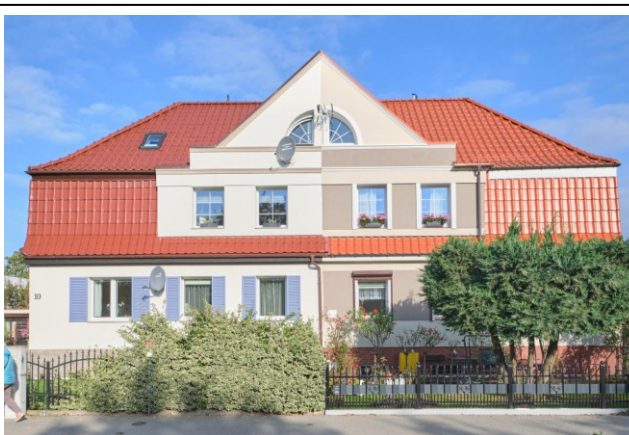
Elewacja frontowa, południowa