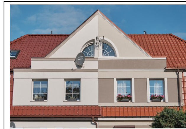
Szczyt wieńczący elewację frontową