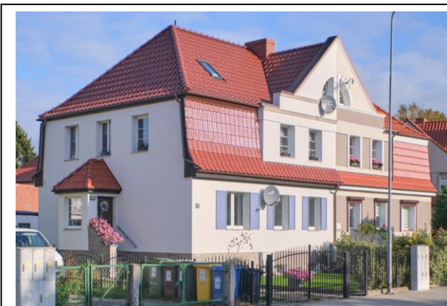
Widok ogólny bryły od strony południowo-zachodniej