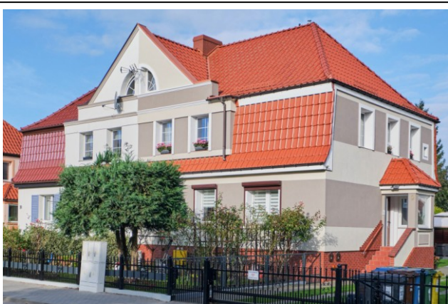
Widok ogólny bryły od strony południowo-wschodniej

7. Fotografia z opisem wskazującym orientację albo mapa z zaznaczonym stanowiskiem archeologicznym