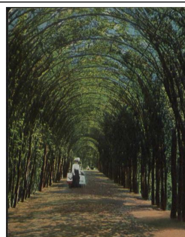
Kołobrzeg – ul. Spacerowa – park – bieżący przed 1920 r.