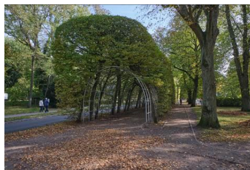
Widok na bindaż grabowy