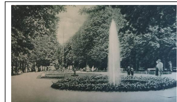
Kołobrzeg – Spacerowa – park – Plac Koncertów Porannych, ok.1920 r.