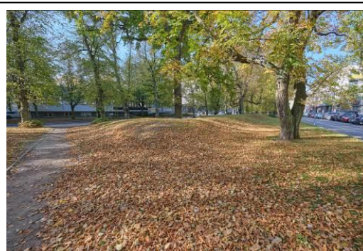
Widok na część zach. zespołu, aleja lipowa