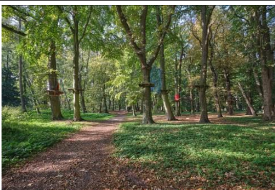
Widok części wsch. zespołu, park linowy